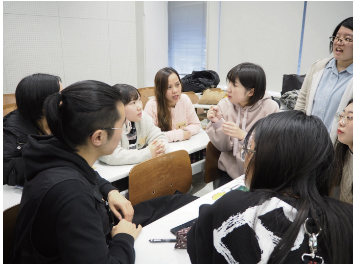
活動の様子・留学生と楽しくおしゃべり。