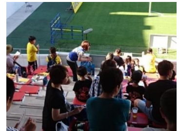
調査の様子(写真中央が調査員)

2018年は6月16日(土)にミクニワールドスタジアム北九州(北九州市小倉北区)で開催された2018明治安田生命J3リーグ第14節 ギラヴァンツ北九州 vs YSCC横浜において調査を実施し、426サンプルの有効回収を得ました。調査にご協力いただいた皆様に感謝申し上げます。