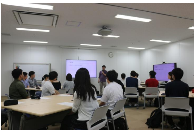
ヤフーニュース編集部によるワークショップ

ヤフー株式会社北九州センターは、国内でも第2番目の規模を誇るヤフー拠点です。北九州の若者に対する認知度向上と情報技術を通じた地域貢献がしたいというヤフー側の想い、学生たちのキャリアアップや地域への関心度を高めたい、という北九州市立大学及び COC+事業側の想い、その両方の目的が上昇効果を生み出した3日間でした。特に、ヤフー北九州センターで活躍している北九州市立大学出身の社員が学生のチューターとして各学生のチーム（6人ずつの4つのチーム）に参加してくださったこと。学生自ら北九州地域の課題を探索して、それに対する解決策を探るといって課題解決型のワークショップであったこと。この2つの面は学生からも非常に良い評価をいただきました。ワークショップで導出された課題と解決策は、北九州市役所・ヤフー・地域戦略研究所の関係者の前でプレゼンテーションされて、有意義な議論が行なわれました。本内容は、ヤフー株式会社北九州センターの公式 SNS にも公開されています。今後も北九州市立大学とヤフー株式会社北九州センターは、持続的に協力しながら学生の成長と地域の発展に力を尽くしていく予定です。