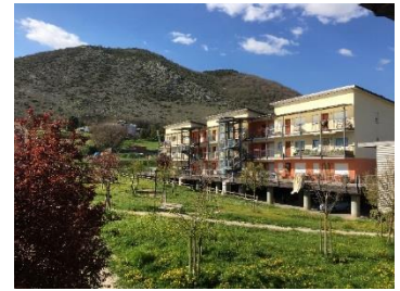
ラクイラの仮設住宅

科学研究費基盤(B)「災害や地域の特性に対応した木造応急仮設住宅の供給手法に関する研究」の一環で、2009年に発生したラクイラ大地震、及び2016年に発生したアマトリーチェ大地震の被災地を2018年4月17日から5日間の日程で訪問しました。ローマでは中央政府の機関である市民安全省で、大規模災害時の国レベルでの指揮命令系統などについてヒアリングを行うとともに、平常時の警察、消防、軍、沿岸警備隊、赤十字等の職員による組織横断的な監視体制を目の当たりにしました。イタリアでは倒壊した建物も、部材を集めなおし、ほぼ元通りに修繕するのが基本であるため、地震から10年近くたったラクイラ市も依然として復興半ばという状況でした。住宅の復興には相当な期間をかけて取り組まざるを得ないため、仮設住宅は10年以上住むことを前提としており、家具や家電製品はすべて揃い、収納も多く確保されるなど、日本のグレードとは全く異なっていました。防災・減災に向けた行政の姿勢、住民に寄り添った支援体制など、イタリア流の取り組みは今後の応急仮設住宅のあり方を考えるうえで大いに参考になりました。