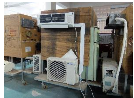
空調機器の修理キット (ITI)