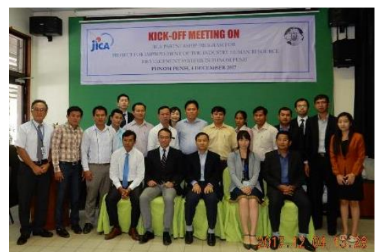
キックオフ・ミーティング出席者