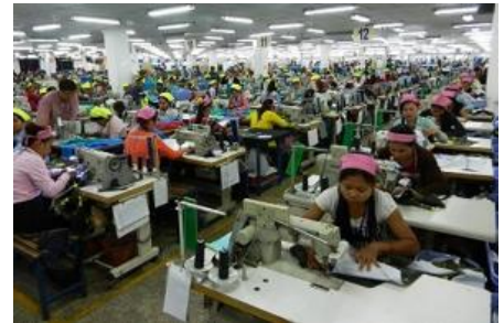
縫製工場の様子 (注1)