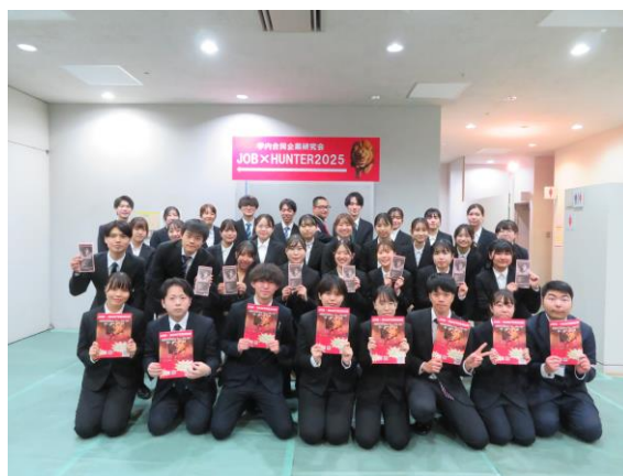
&lt;昨年度学生スタッフによる集合写真&gt;