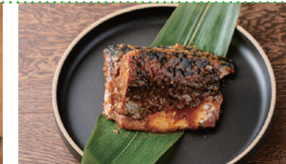
⑥ ぬか味噌焼きセット [宇佐美商店/旦過市場]