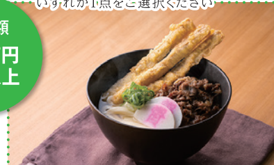
⑤ 肉ごぼ天うどん5人前[資さんうどん] ※写真はイメージです