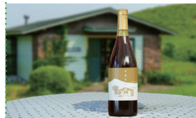
⑧ 平尾台ワイン「ピノ ノワール」 [ドメヌ・ル・ミヤキ]