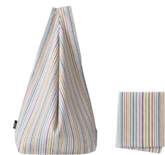
⑨ 小倉織シンプル バッグS&小風呂敷 (ハンカチ)セット (柄名:白多彩)[小倉 縞織]