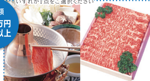
⑩ 小倉牛特選ロース しゃぶしゃぶ肉700g[野村肉舗]