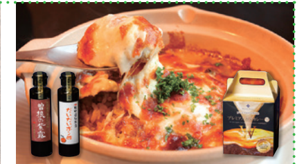
⑦ プレミアム焼きカレー5個と 曾根の紫露(醤油)・ だいたいポン酢セット [プレミアホテル門司港]