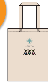
② オリジナルトートバッグ