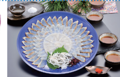
⑪ ぶく太郎本部 食楽庵ふる川 ぶく刺三種盛り [北九州観光コンベンション協会]

※返礼品は、追加・変更となる場合があります。北九州市立大学基金ホームページでご確認ください。