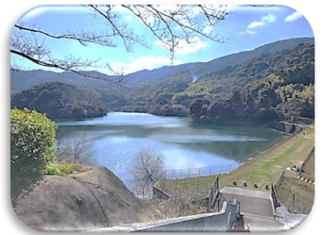
爽やかな風景が広がる～