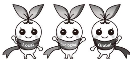
北九州市立大学 公式マスコットキャラクター きたきゅっち

③ 提出書類は返却できませんので、ご了承ください。なお、取得した申込者の個人情報については、採用試験以外の目的で使用することはありません。