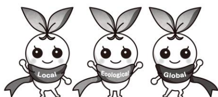
北九州市立大学 公式マスコットキャラクター きたきゅっち

③ 提出書類は返却できませんので、ご了承ください。なお、取得した申込者の個人情報については、採用試験以外の目的で使用することはありません。