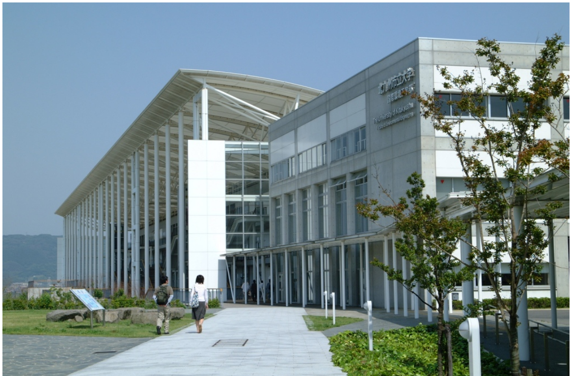
「ひびきのキャンパス」