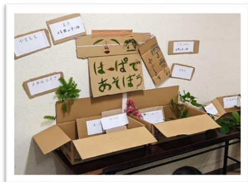
【菜園コーナー】 はっぱであそぼう！…大学構内のいろんな「はっぱ」を知りました！