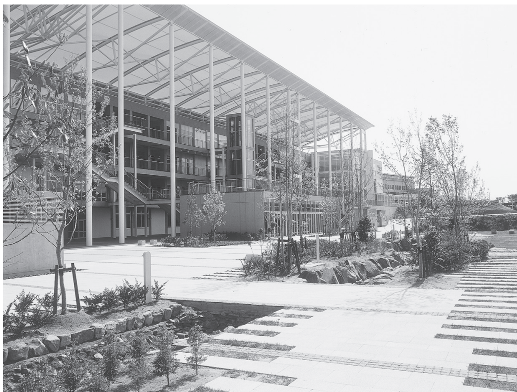
ひびきのキャンパス