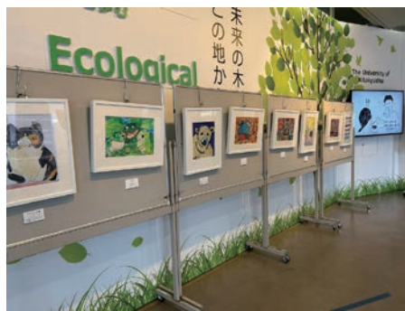
2023年度の展示会の様子