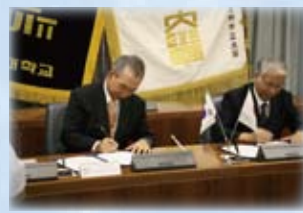
韓国仁川大学校との協定締結調印