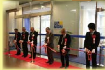
オープニングセレモニーのテープカット

本学では、平成17年4月の法人化以降、「入試から就職まで一貫した教育システムの構築」に取り組んできました。本学に入学した学生が充実したキャンパスライフを送り、自らの進路を見だし、それに適った職業に就けるよう、きめ細かなサポートをする体制の整備を順次進め、今回、学生サポートを実践する場として、学生プラザを整備しました。