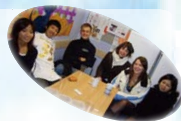
交換留学生同志で ～カーディフ大学にて～