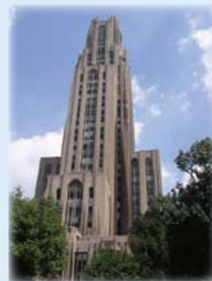
ピッツバーグ大学