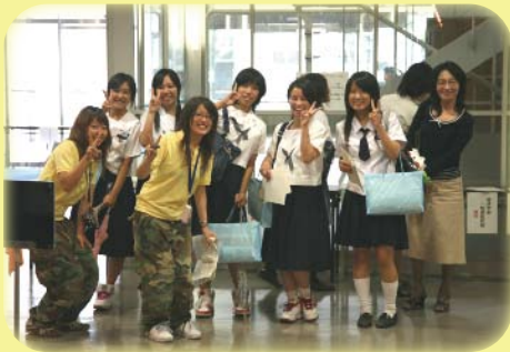
学生スタッフとキャンパスツアーへ

夏とは違い、イベントを絞り、相談コーナーや模擬授業中心のプログラムを用意し、じっくり話しを聞けるように配慮しました。