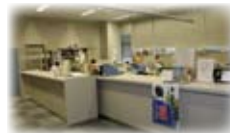
本館D棟1階に移動した学生課学生係（学生課）