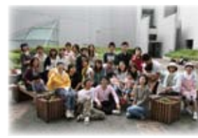
菜園活動どなたでも参加自由!