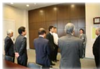
学長室での入学式