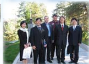
現地スタッフの方々と