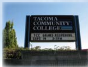
米国タコマ・コミュニティカレッジ

英米学科を中心に、本学の姉妹校の一つである米国タコマ・コミュニティカレッジへの半年間の派遣留学を平成20年度第2学期より実施します。派遣人数は、平成20年度第2学期に外国語学部英米学科2年生25名、平成21年度第1学期に英米学科3年生15名、他学科15名の予定です。現地では特別プログラムが用意され、高度な英語力養成を図るコースを中心にアメリカ現代史等アカデミックな内容を学べるものとなっています。