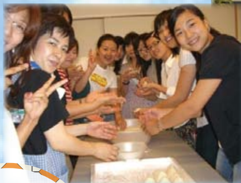
焼肉会にておにぎり作り