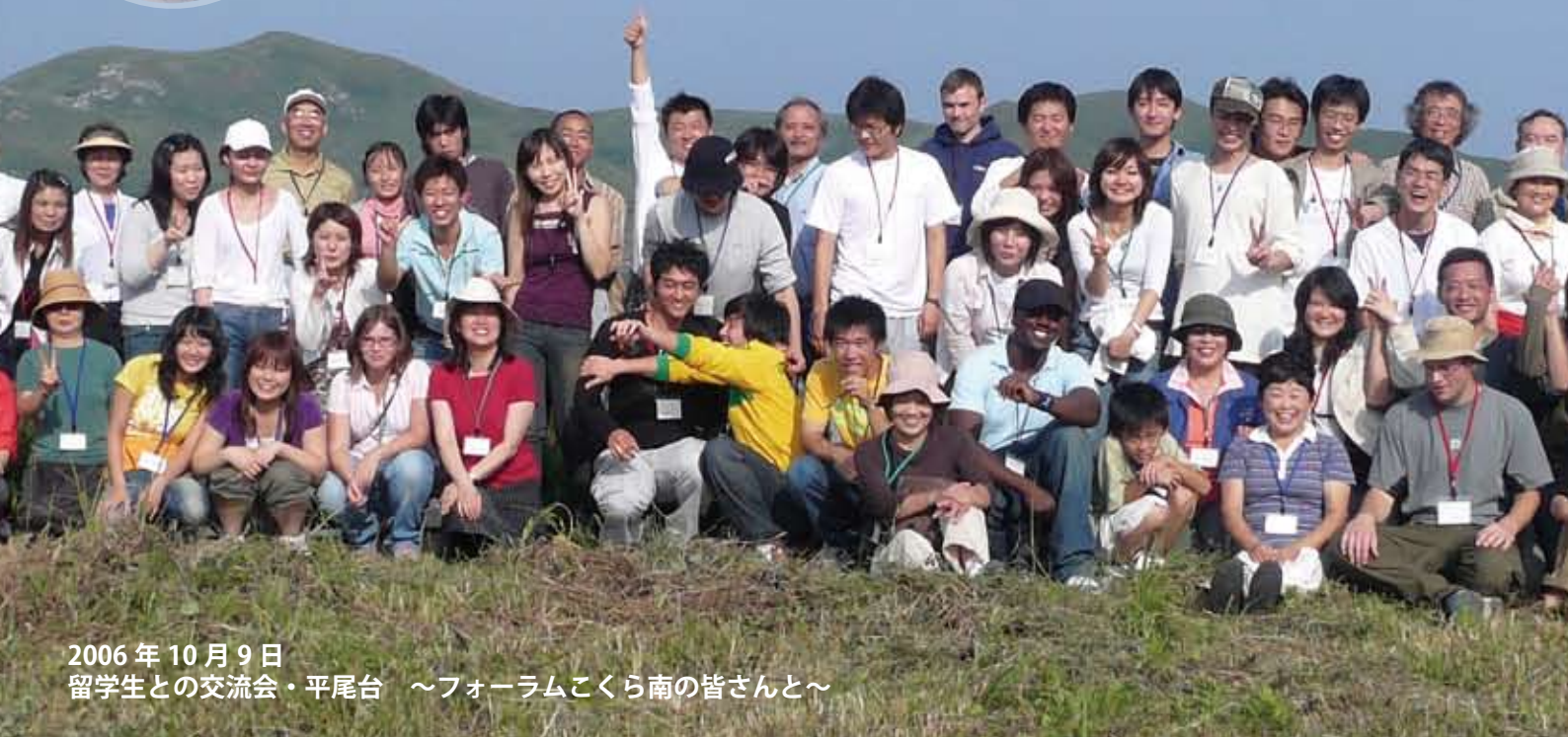
2006年10月9日 留学生との交流会・平尾台 ～フォーラムこくら南の皆さんと～