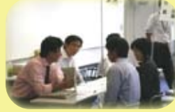
真剣に話を聞く受験生と保護者