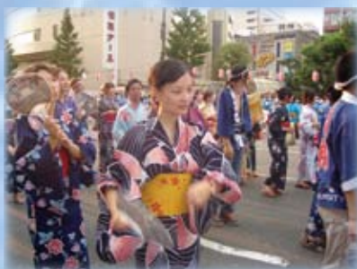
わっしょい百万夏祭り

また、留学生を支援する市民団体である「フォーラムこくら南」（北方）や「ボランティアひびきの」（ひびきの）の方々には留学生が日本での生活や文化に馴染み、理解し交流するためのイベントの実施や、生活面のサポートをしていただいています。