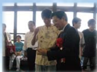
日中国際交流ナンチャオ芸能祭