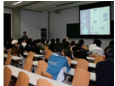
▲オープンキャンパスでの公開講座