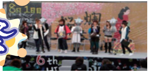
▲ひびきの祭ステージイベント(ひびきのキャンパス)