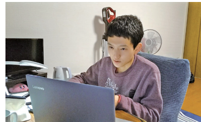
◀自宅で遠隔授業を受講する様子

A: 放送研究会、声劇研究会ではサークル棟や教室が使えず、学内での活動が再開できていません。1年生の勧誘には、Zoomを使い制作したサークルの紹介動画をSNSへ投稿しました。