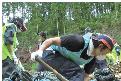
被災地での土のう作り(第1次派遣)▲

※地域社会における実践活動を通じ、次世代を担う人材の育成を目指すとともに、本学の地域貢献の一翼を担うことを目的に設置された組織。