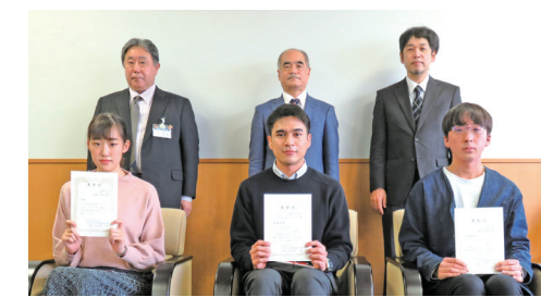
ブランディングデザイン表彰式▲

ブランディングデザインは、2021年度からひびきのキャンパスホームページなどに登場する予定です。