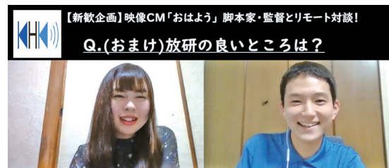
【新企画】映像CM「おはよう」脚本家・監督とリモート対談! Q.(おまけ)放研の良いところは?