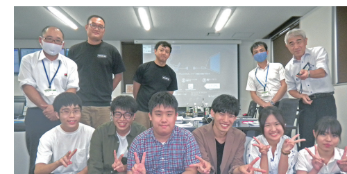
インターンシップの様子▲