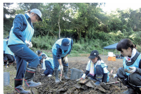
畑に埋まったがれきの撤去作業(第7次派遣)▲