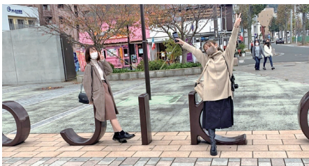
◀感染症対策をしつつ友人と門司港観光へ。久しぶりに会って、適度なストレス発散に。