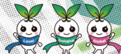
北九州市立大学 公式マスコットキャラクター きたきゅっち